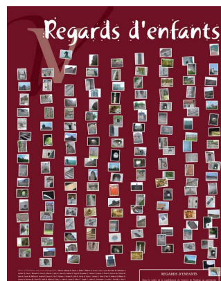
Exposé sur la façade de l'ancien cinéma Piazza Lumière, rue des Granges.

Ce projet pédagogique est reconduit cette année scolaire.