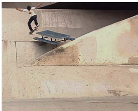
Image extraite vidéo Topographie anecdotée du skateboard

Le film suit les skateurs dans leur recherche de nouveaux terrains de jeu : banals trottoirs, bancs publics, gigantesques canalisations à l'abandon, rampes d'escalier, etc. Il pose ainsi la question de l'espace public car, si l'architecture et le mobilier urbain induisent les comportements à adopter, le skateur ignore et détourne ces usages. En cela, son attitude est subversive. Les skateparks constituent la réponse des collectivités pour tenter de circonscrire et assimiler cette pratique. Ainsi et, paradoxalement, le skateboard a durablement modifié le paysage des villes.