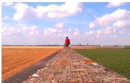
Image extraite video Pentacycle

Ce que le Pentacycle de Vincent Lamouroux et Raphaël Zarka « perd en efficacité physique, il le gagne en efficacité suggestive, ou poétique ». Conçu pour rouler exclusivement sur le rail construit dans les années 60 pour l'aérotrain de l'ingénieur Bertin -ou plutôt sur ce fragment de rail qui se présente aujourd'hui comme une ruine moderne ne reliant rien à rien, sans départ ni fin - le Pentacycle est un véhicule hybride qui n'est pas destiné à être emprunté sinon par l'imaginaire. Une machine à fiction. Désormais statique, il est présenté telle une sculpture, et est accompagnée d'une vidéo qui montre son déplacement (réel) le long des 18 km du rail abandonné ainsi que les paysages qu'il traverse (champs, forêts, zones industrielles et résidentielles). Comme l'écrit Christine Macel, Le Pentacycle « consiste finalement à faire revivre une entreprise dont l'échec aura été à l'origine d'une œuvre »