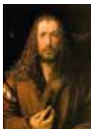
Albrecht Dürer 1500

Quel autoportrait se rapproche le plus de ceux de Rosana Paulino selon toi ? _____