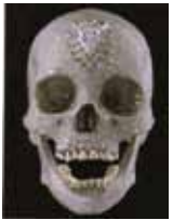
Damien Hirst 2007