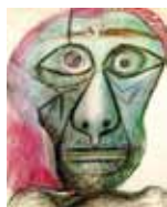
Pablo Picasso 1972

Maintenant, observe les autoportraits ci-dessous :