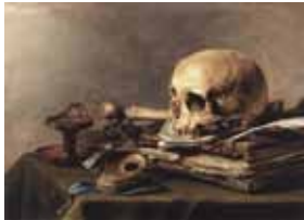
Pieter Claesz 1630